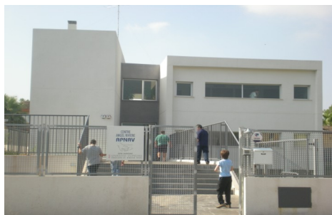
El centro de día "Ángel Rivière" de APNAV es el único dedicado a personas con TEA en la provincia de Valencia

Para cualquier consulta, contactanos en nuestro teléfono (96-3842226) o a través del correo: asociacion@apnav.org